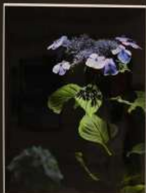
群 加茂町 早田 森本幸治 2011年撮影