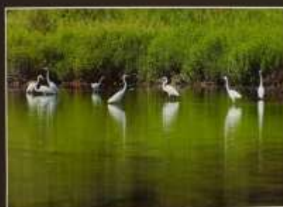
群の集い 加茂町 早田 森本幸治 2011年撮影