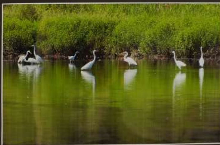
群の集い 加茂町 早田 森本幸治 2011年撮影