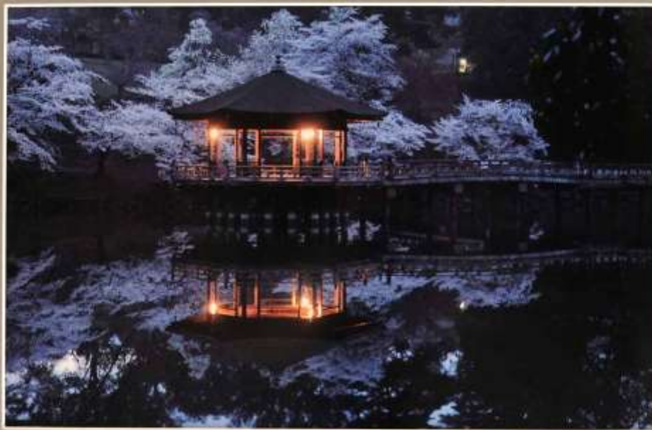
黎明に浮かぶ双子堂